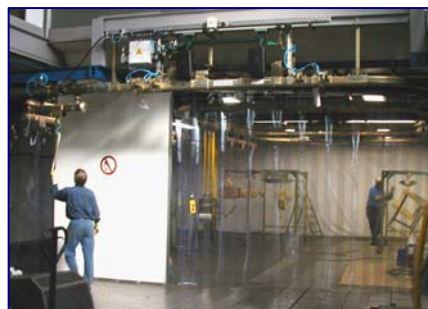
Neue Lackierkabine bei JDN New Paintshop at JDN

Zur Optimierung der innerbetrieblichen Abläufe haben wir eine neue Lackierkabine errichtet. In ihr können nun auch problemlos mehrere große Hubwerke parallel lackiert werden. Dies wirkt sich besonders positiv bei Offshore-Lackierungen (4fach-Anstrich) aus. Die moderne, umweltfreundliche Anlage ermöglicht uns, flexibel auf Kundenwünsche zu reagieren.